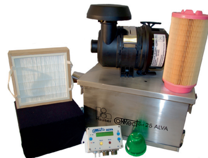
CoRRect air 25 ALVA kompakt

Damit ist das Dienstleistungsportfolio noch längst nicht erschöpft: Der Brand-schutzexperte erstellt darüber hinaus Flucht- und Rettungspläne sowie Evaku-ierungs- und Feuerwehrpläne. Und damit im Brandfall der sichere Umgang mit dem Brandschutzgerät auch 100-prozentig sitzt, schult das Hauser-Team seine Kun-den sowohl in Theorie als auch in Praxis. Unter Realbedingungen üben kann man beispielsweise bei umfassenden Schu-lungen mit dem so genannten mobilen